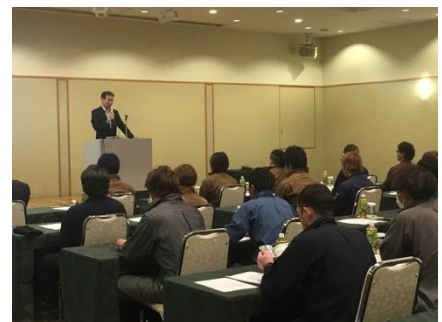
▲フルハーネス型安全帯特別教育の様相

2019年2月の法改正により、高所作業等におけるフルハーネス型の墜落制止用器具の使用が義務化されました。また作業員に対してこの墜落制止用器具の使用法を含めた学科と実技の特別教育を実施する必要があります。建設業界全体の安全衛生に貢献していきたいとの考えのもと、タカミヤでは「フルハーネス型安全帯特別教育」に力を入れており、この講習会も年初来600名以上の方が受講されました。多くの方にご来場いただき建設資材展の出展にあわせ、会場内※でこの特別教育講習会を受講していただけるようにいたしました。