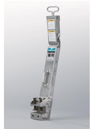
▲衝撃吸収型親綱支柱 (100kg 対応) 「ディンプルポスト X」